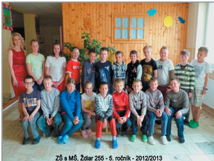
ZŠ s MŠ, Ždiar 255 - 5. ročník - 2012/2013

V posledných rokoch sa nám darí úspešne využívať informačné a komunikačné technológie vo vyučovaní. Celkovo škola vlastní 29 počítačov s prídavnými zariadeniami (kopírky, tlačiarne, dataprojektory, fotoaparát, kameru, USB kľúče...), ktorými je vybavená už spomínaná počítačová učebňa a jednotlivé pracoviská. Zriadili sme webové sídlo, kde pravidelne informujeme o aktivitách školy. Využívame žiacku internetovú knižku.