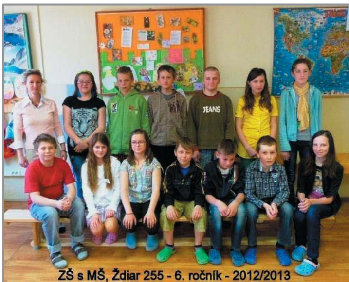
ZŠ s MŠ, Ždiar 255 - 6. ročník - 2012/2013