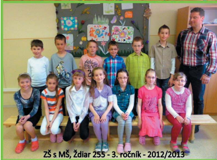
ZŠ s MŠ, Ždiar 255 - 3. ročník - 2012/2013