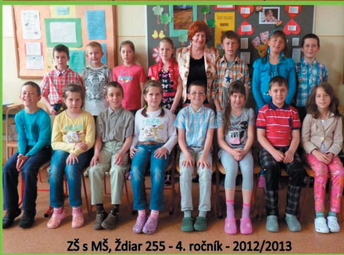
ZŠ s MŠ, Ždiar 255 - 4. ročník - 2012/2013