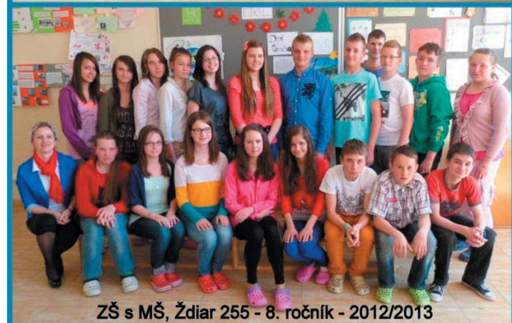
ZŠ s MŠ, Ždiar 255 - 8. ročník - 2012/2013