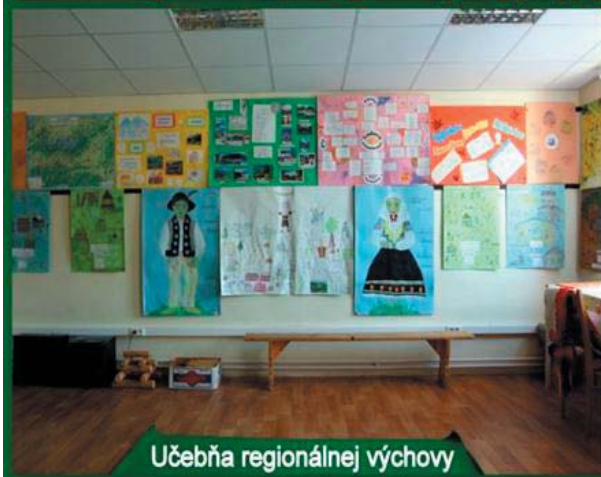
Učebňa regionálnej výchovy