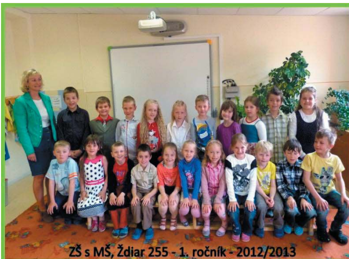
ZŠ s MŠ, Ždiar 255 - 1. ročník - 2012/2013

Spomínané klimatické podmienky v Ždiari odjakživa vytvárali širokú škálu možností venovania sa športom – nielen v zimnom, ale aj v letnom období. Preto škola zapracovala do školského vzdelávacieho programu svoj vlastný predmet – lyžovanie, posilnili sme hodiny telesnej výchovy a záujmovú mimoškolskú činnosť orientujeme tiež na šport a turistiku. V rámci týchto hodín sa žiaci počas vyučovania chodia lyžovať, korčuľovať, behať, hrať futbal, hokej, florbal,... Pravidelne každú zimu v spolupráci s ob-