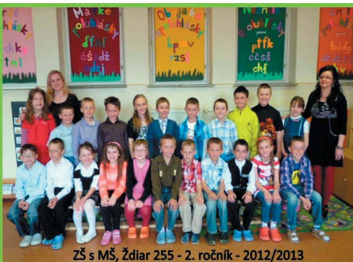
ZŠ s MŠ, Ždiar 255 - 2. ročník - 2012/2013