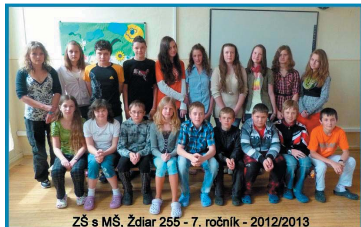
ZŠ s MŠ, Ždiar 255 - 7. ročník - 2012/2013