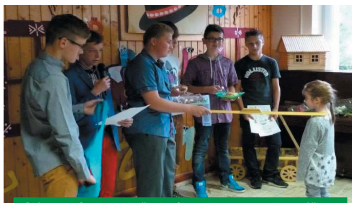
Slávnostné otvorenie školského roka, pasovanie prváčikov